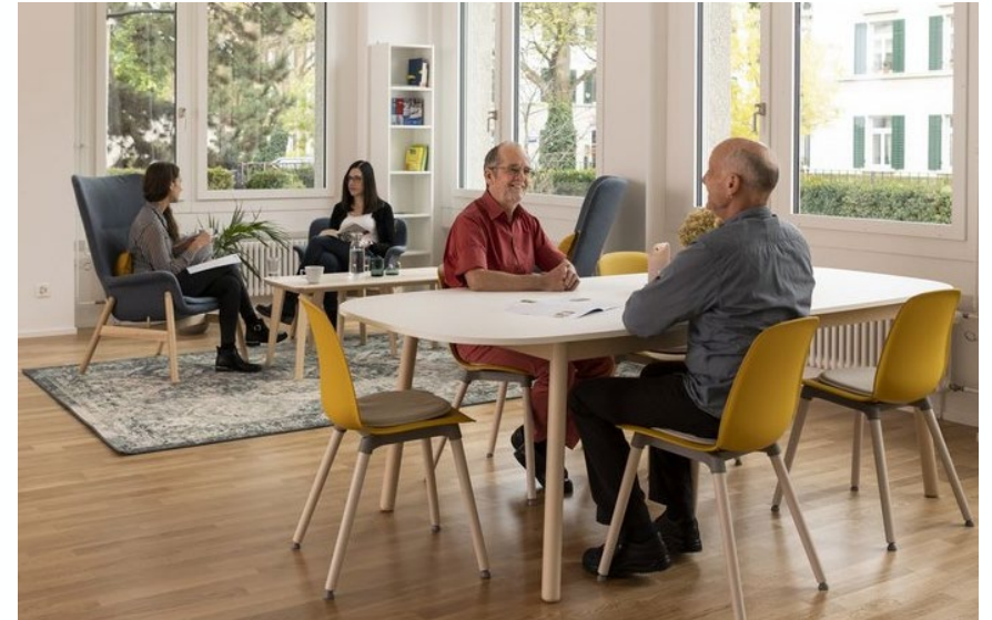
Begegnungszentrum Wäldli, Krebsliga Zürich